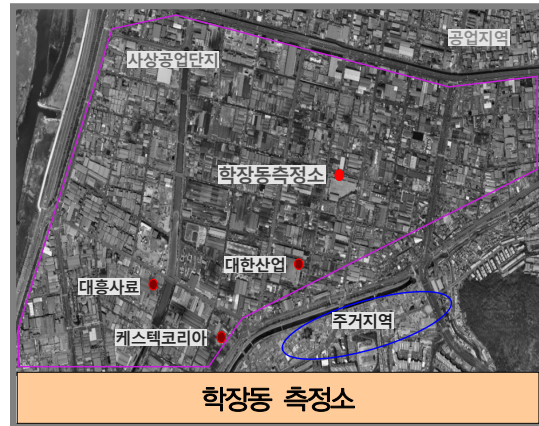
그림 1. 측정망 위치